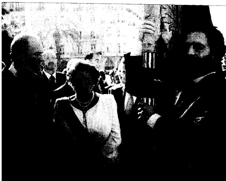
Alberto Fabra, presidente de Valencia, y la alcaldesa Rita Barberá, en 2014.

En 1995, cuando el PP ganó las elecciones por primera vez, la Generalitat abandonó durante una década las reputadas encuestas de uso y conocimiento del valenciano del Servei d'Estudis i Investigació Sociolingüís-