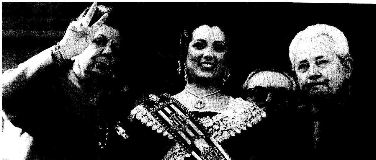
La alcaldesa de Valencia, ayer en la primera mascletà en el balcón del Ayuntamiento junto a la fallera mayor y el embajador de Chile.